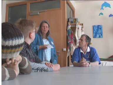
Schülerinnen und Schüler reflektieren das Erlebte